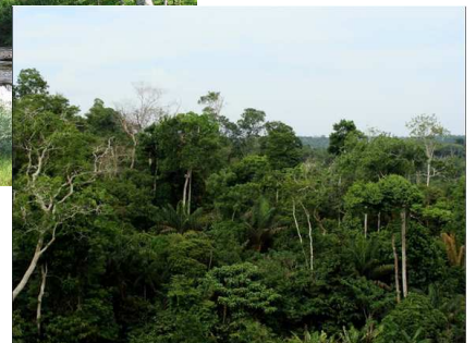
6 photos de forêt tropicale humide et 6 autres de forêt boréale (cycle 2)