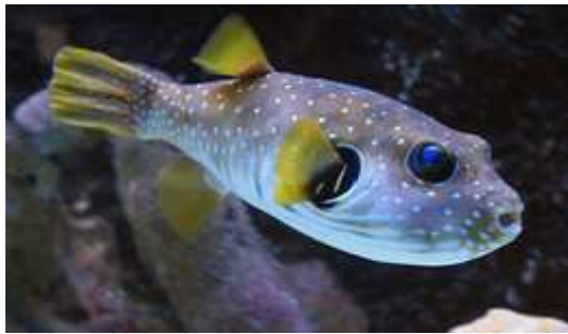
6 images de poisson