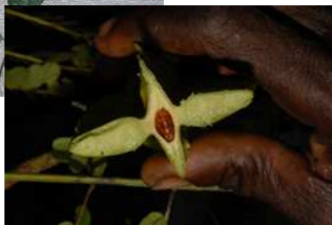
12 photos du fruit du tetrapleura tetrapetra entier ou ouvert avec graine (cycle 2)