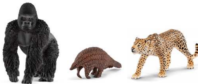
3 lots de figurines : gorille, pangolin et léopard (cycle 1)