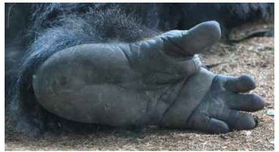
6 photos de pied de gorille